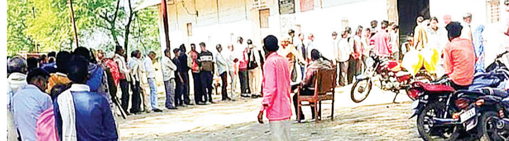
हरिभूमि न्यूज ललितपुर

मड़ावरा तहसील क्षेत्र के ग्राम सैदपुर में बुधवार दोपहर करीब 11 बजे कुछ किसानों ने साधान सहकारी समिति सैदपुर पर यूरिया खाद न मिलने का हवाला देते हुए सड़क जाम कर दी। जिससे कुछ समय के लिए यातायात बाधित हो गया और दोनों तरफ वाहनों की कतारें लग गईं। सड़क जाम की सूचना मिलने की पर पुलिस और उप